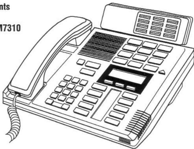
Tableau de voyants d'occupation fixé à un poste M7310

Les voyants du TVO sont disposés de façon à correspondre aux touches mémoire bifonctions situées au-dessus de l'afficheur du poste M7310. Chaque moitié de touche mémoire bifonction, programmée comme touche composition automatique de numéro intérieur, correspond à une moitié d'un voyant du TVO. Suivant la programmation de numéros intérieurs sur les touches mémoire bifonctions, le voyant (supérieur ou inférieur) devient visible pour signaler un appel en cours au poste correspondant au numéro programmé.